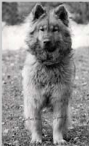
Lotus vom Jägerhof (29.08.1970)