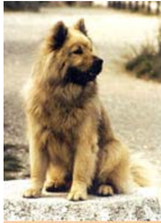
Rurik v. Jägerhof (*10.08.74)

Rurik vom Jägerhof , seine Nachkommen und die hier gezeigten vergleichbaren Eurasier vertreten beispielhaft die Generationen der Rückpaarungen auf Jägerhoftiere. Dies war erforderlich um die Streubreite im Erscheinungsbild und im Verhalten einzugrenzen, und um die Jägerhof-Eigenschaften und Merkmale zu sichern. Gleichzeitig konnte die HD-Belastung auf ein erträgliches Maß reduziert werden.