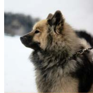
Xoro vom Jägerhof (* 19.01.1980)