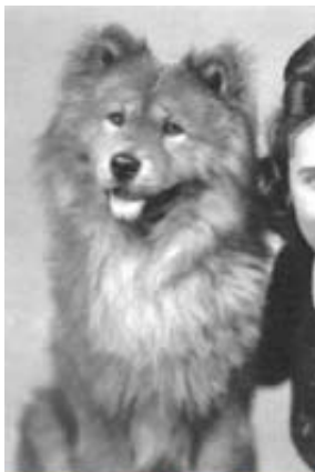
Chow-Chow (aufgen. 1940)

Hier möchte ich Ihnen einmal ein zuverlässig datiertes Foto eines Chow-Chows vorstellen, aufgenommen 1940 in Erfurt, damit Sie auch sehen von welchem Typ von Chow-Chow hier die Rede ist.