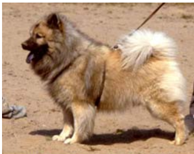
Billy vom Schönaich (* 20.05.1982)