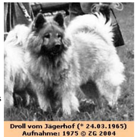
Droll vom Jägerhof (* 24.03.1965) Aufnahme: 1975