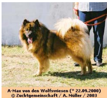
A-Max von den Wolfswiesen (* 22.09.2000)