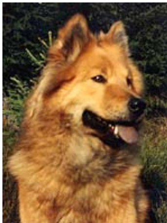
Jerry v Jägerhof (24.12.68)