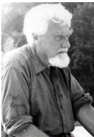
Prof. Dr. Konrad Lorenz

Also: Wo fangen wir an? Wenn man die Geschichte der Eurasierzucht insgesamt betrachtet, so fallen einem einige recht markante Persönlichkeiten und Umstände auf, die zur Entwicklung dieser - immer noch neuen und noch lange nicht fertigen - Hunderasse geführt haben. Diese Persönlichkeiten möchte ich ihnen vorstellen. Gleichzeitig nehme ich die Gelegenheit zum Anlass, Sie mit den ursprünglichen Motiven, Ideen und Zielen der Eurasierzucht vertraut zu machen, in der Hoffnung, dass diese Idealvorstellungen als solche im Bewusstsein verbleiben und als Richtschnur der Zuchtarbeit dienen werden.