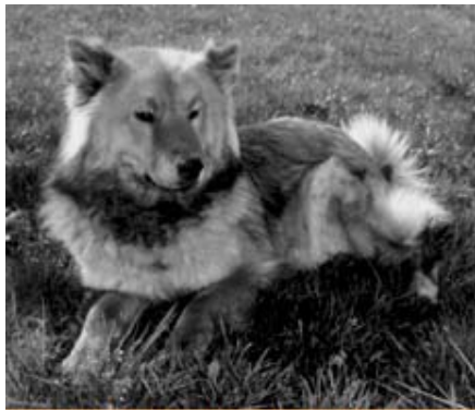
Cara-Lu vom Jägerhof (15.08.63)