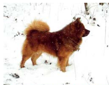
Apollo vom Schwartenmoor (* 08.08.2002)