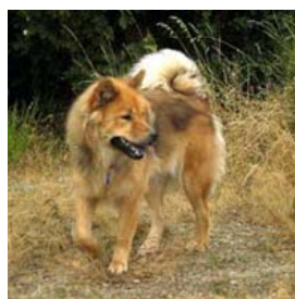
Abea v Streeker Forst (* 30.12.2001)