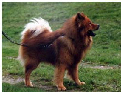
Dosto vom Kleinkoogsdeich (* 21.12.1994)

Lohnt sich der Aufwand? "Hat es denn seine Berechtigung, zu den vielen Hunderassen, die es heute gibt, noch eine weitere zu kreieren? Ich glaube ja", so schrieb Konrad Lorenz 1949. Und weiter: "Dazu brauche ich aber einen Hund, der keine Modetorheit ist, sondern ein lebendiges Tier, kein Kunstprodukt und Triumph formzüchterischen Könnens, sondern ein natürliches Wesen mit unverbildeter Seele. Ich will Hunde ausgesprochen mit dem Zuchtziel einer idealen Vereinigung der seelischen Eigenschaften von Lupus- und von Aureushunden züchten, einen Hund der speziell das zu geben imstande ist, was der arme, zivilisierte und auf dem Asphaltboden lebende Mensch vom Hund erwartet und braucht" .