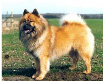
Gordon von den Sander Tannen (* 31.12.1997)