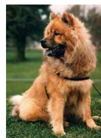
Charan v. Hasenmoor (* 04.03.1997)

Aber was wissen wir schon? Wir können nicht in die Tiere hineinschauen, wir wissen nicht welche genetischen Überraschungen in ihnen stecken. Umso wichtiger ist es, das knappe, wirklich gesicherte Wissen über unsere Hunde vernünftig einzusetzen. Zucht ist immer eine Risikoabwägung. Eine weitere Aufgabe besteht darin, Verwandtschaftsverpaarungen zu vermeiden. Was zu Beginn einer Rasseentwicklung unumgänglich ist, nämlich enge Verwandtschaftszucht, um Fehler früh zu erkennen und erwünschte Merkmale zu festigen, ist in späteren Zuchtstadien unbedingt zu vermeiden, um die Zuchtbasis nicht einzuengen. Eine wirksame Zuchtbasiserweiterung wird aber speziell beim Eurasier zuverlässig nur über eine regelmäßige Einmischung der Ursprungsrassen möglich sein. Das war bisher unter dem Dachverband VDH nicht erlaubt. Seit ca. zwei Jahren wurde einem Antrag des EKW, dem sich