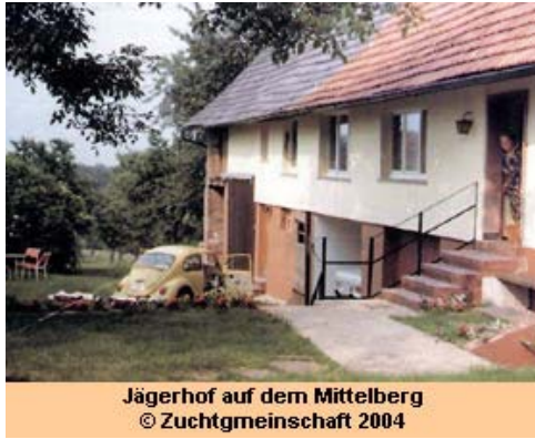
Jägerhof auf dem Mittelberg