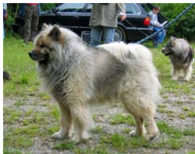
Devil von Kösterberg (* 25.04.1990)