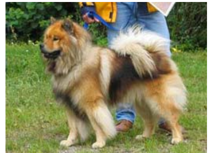
Arko zum Crutzen (* 08.12.1998)

Meine Damen und Herren, das waren von Anfang an die anzustrebenden Vorgaben für unsere Eurasierzucht und das sind sie auch heute noch. Wenn wir diese Lorenz'schen Ideale in unserem Zuchtziel vernachlässigen oder gar verlieren, dann, dessen bin ich mir sicher, hat die Eurasierzucht ihren Sinn verloren. Hoffen wir auch weiterhin engagierte Menschen zu finden, die uns durch ihren persönlichen Einsatz helfen, die Eurasieridee im ursprünglichen Sinne in die Zukunft weiter zu tragen.