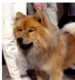
Derry vom Brenneck (* 12.01.1981)