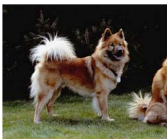
Charly vom Lerchenberg (* 26.03.1986)