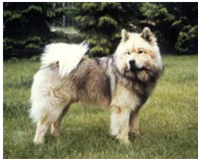
Dronje vom Stratenhof (* 22.04.1984)